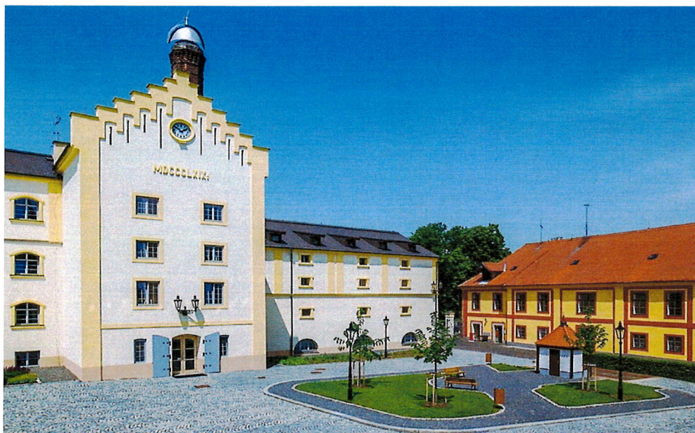
U Pivovaru 1, 270 53 Krušovice

si Vás dovolují pozvat na Setkání Zasloužilých hasičů Středočeského kraje